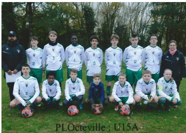
PLOcéville : U15A